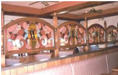
r -26 (上) ・ r -27 (下)